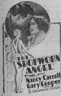
Añoche se estrenó en el Raventos otro grandioso éxito Paramount, la divina y bella película

“El Angel Pecador” por Gary Cooper y Nancy Carrol es una película sublime hoy se da en el Raventos por 2a vez