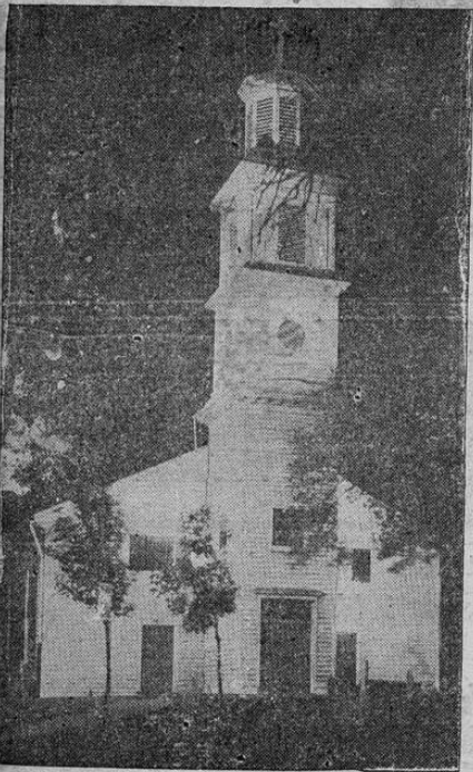
La histórica iglesia de San Juan, en Richmond, Virginia, en uso desde 1741, y en la cual Patrick Henry pronunció su famosa frase "Dadme libertad o dadme la muerte", será cerrada al servicio para ser conservada como monumento nacional.

Los afanes de la suerte, tal podria denominar a estos dos aspectos que hoy ofrecemos a nuestros lectores. De un lado, vemos a los vendedores de loteria, pasando "las del hilo azul" frente a las ventanillas de la Junta de Caridad, para obtener billetes; y del otro, a la esperanzada multitud que todos los dominos se reúne en el Parque Central esperando que "les caiga el gordo".