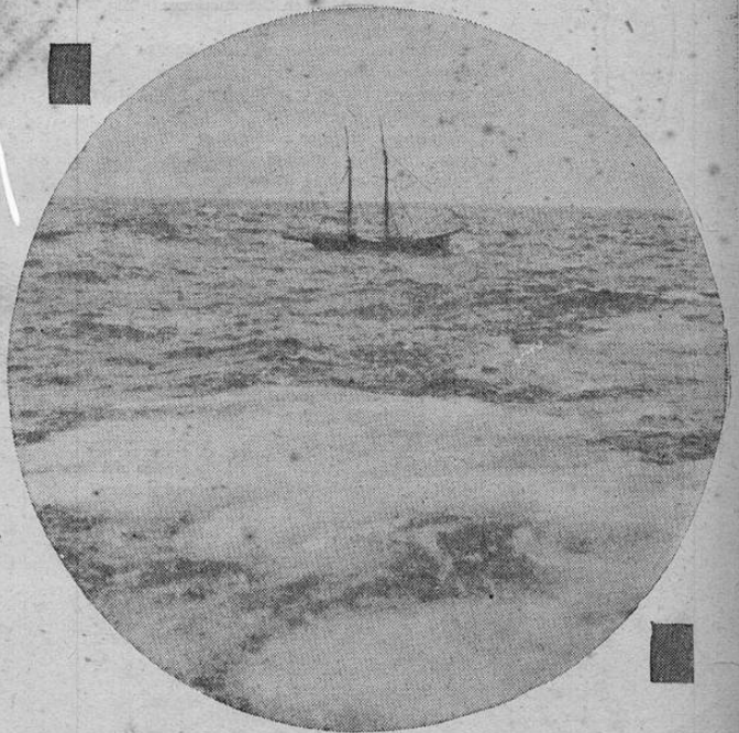
Once tripulantes fueron salvados de la goleta Gander Deal por el vapor REPUBLIC, en medio Atlántico. Esta foto, tomada desde dicho vapor, muestra a la goleta abandonada a merced de las olas.

Más de quinientas personas rindieron homenaje en Sarajevo al asesino del archiduque Fernando lo cual originó la Guerra Europea